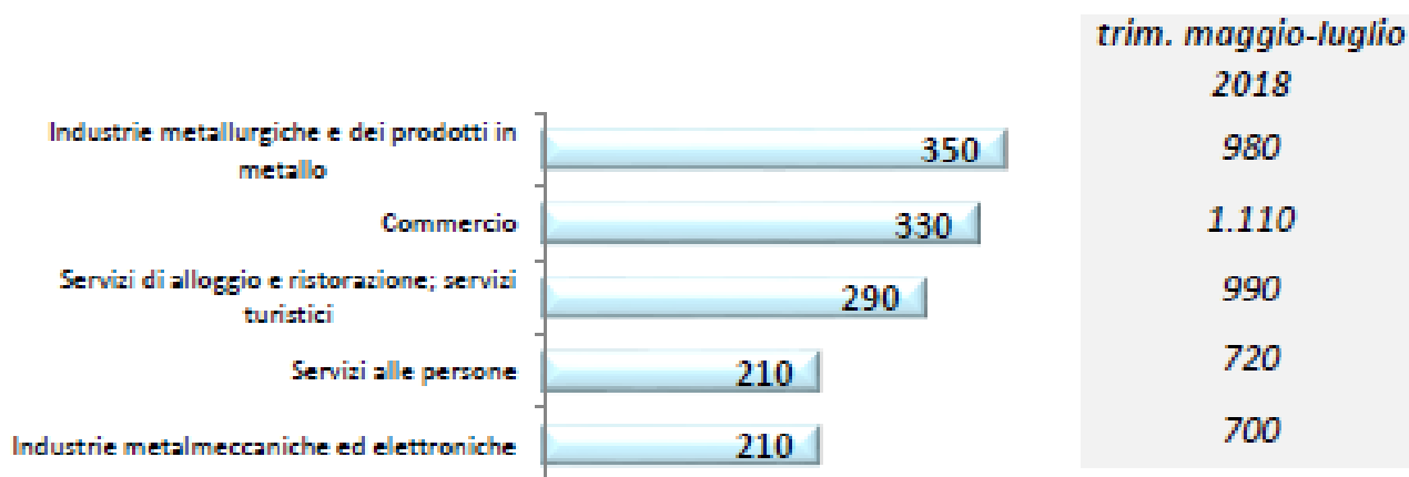
Graf. 1 - Provincia di Lecco: assunzioni previste MESE DI MAGGIO e periodo maggio-luglio

Valori assoluti arrotondati alle decine.