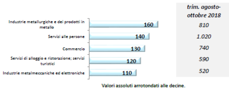
Graf. 1 - Provincia di Lecco: assunzioni previste MESE DI AGOSTO e periodo agosto-ottobre